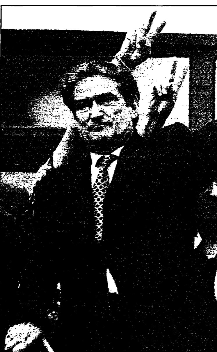
زعيم المعارضة الالبانية صالح بيريشا يسي مزيد من شرفة مقر حزبه أثناء مظاهرة مناهضة للحكومة في تيرانا